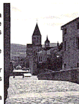
Tour de l'horloge et le clocher hexagonal dit de l'eau-bénite

On nomme Cluny 1 l'église abbatiale dédiée en 927, Cluny 2 celle qui lui a succédé en 981 et Cluny 3 la grande église , maior ecclesia , bâtie de 1088 à 1130. Aujourd'hui, seuls quelques vestiges de cette dernière sont visibles. En effet la dissolution des ordres monastiques par la révolution française a entraîné la dispersion des moines en 1791 . Puis en 1798 les bâtiments sont vendus comme biens nationaux ...à des marchands de pierre !