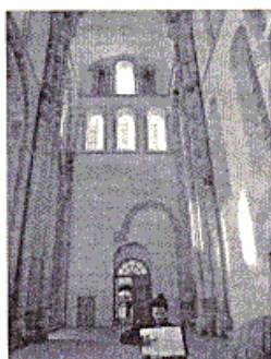
Bras sud du grand transept

Les bâtisseurs de l'abbaye œuvreront aussi à la construction des maisons du bourg , leur conférant une grande qualité architecturale. Les maisons romanes qui subsistent présentent des façades emblématiques composées d'une grande arcade au rez-de-chaussée et d'une claire-voie (suite de baies qui ajourent le niveau d'un bâtiment) à l'étage .