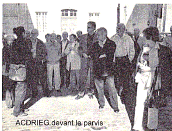
ACDRIEG devant le parvis