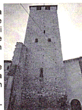
Tour des fromages

Le bras sud du grand transept de Cluny 3, conservé intégralement, est couronné du clocher octogonal dit de l'Eau bénite et de la tour dite de l'Horloge .Les voûtes en berceau brisé culminent à 31 mètres et sont les plus hautes du monde roman . Ce type de voûte permet le percement de grandes ouvertures laissant entrer abondamment la lumière. L'élévation compte 3 niveaux : les grandes arcades, le triforium (passage situé au dessus des grandes arcades) et les fenêtres hautes .