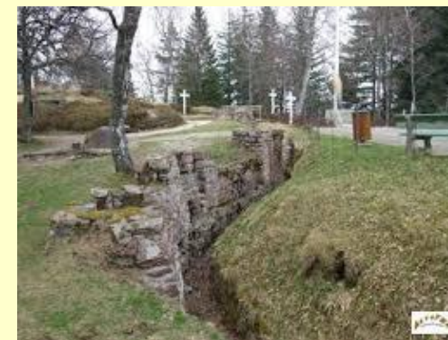
Le collet du Linge