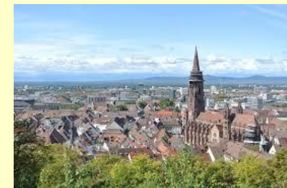
Fribourg en Brisgau