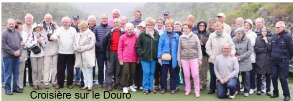
Croisière sur le Douro

2011 : USA (côte Est) – Croisière sur le Rhin, 2012 : Italie de Florence à Rome – Argentine, 2013 : Vietnam Cambodge - Capitales baltes, 2014 : USA Ouest – Sicile/Iles Éoliennes, 2015 : Irlande – Inde du Nord, 2016 : Croisière sur le Douro – Iran, 2017 : Arménie