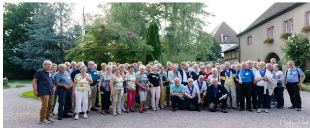
Congrès Colmar septembre 2018

2011 : USA (côte Est) – Croisière sur le Rhin, 2012 : Italie de Florence à Rome – Argentine, 2013 : Vietnam Cambodge - Capitales baltes, 2014 : USA Ouest – Sicile/Iles Éoliennes, 2015 : Irlande – Inde du Nord, 2016 : Croisière sur le Douro – Iran, 2017 : Arménie, 2018 : croisière en Norvège